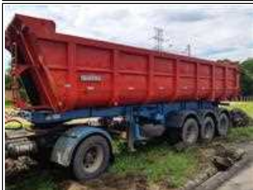
IMAGEM DA LATERAL ESQUERDA