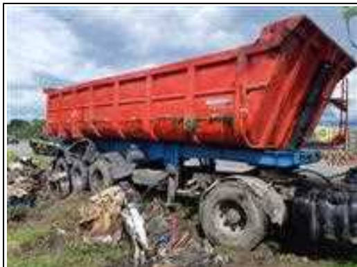
IMAGEM DA LATERAL DIREITA