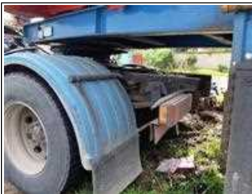
IMAGEM DA TRASEIRA