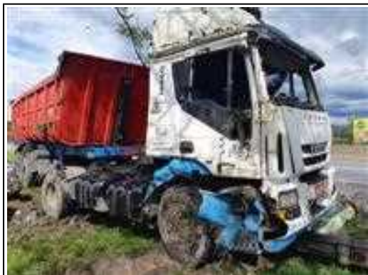
IMAGEM DA LATERAL DIREITA