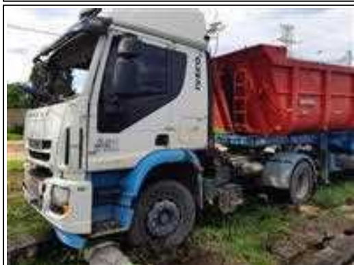
IMAGEM DA LATERAL ESQUERDA