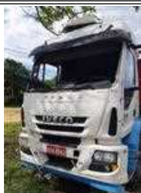
IMAGEM DA FRENTE