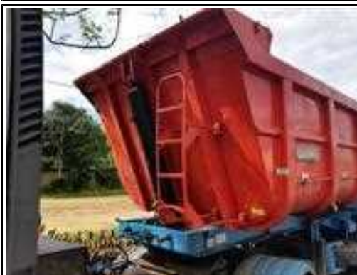
IMAGEM DA FRENTE