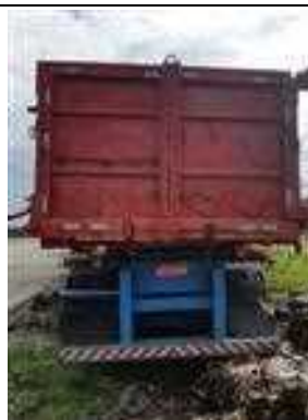
IMAGEM DA TRASEIRA