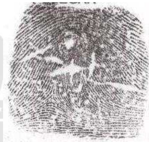
IMAGEM Nº 04 PRESILHA EXTERNA PRONTUÁRIO CIVIL