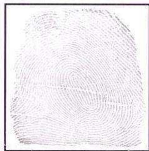
IMAGEM Nº 03 VERTICILLO PLANILHA DE IDENTIFICAÇÃO