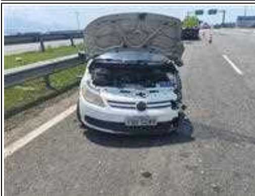
IMAGEM DA FRENTE