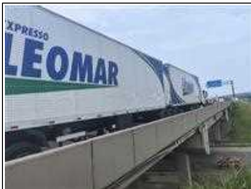
IMAGEM DA LATERAL DIREITA