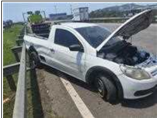
IMAGEM DA LATERAL DIREITA