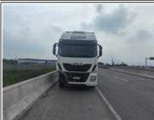
IMAGEM DA FRENTE