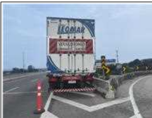
IMAGEM DA TRASEIRA