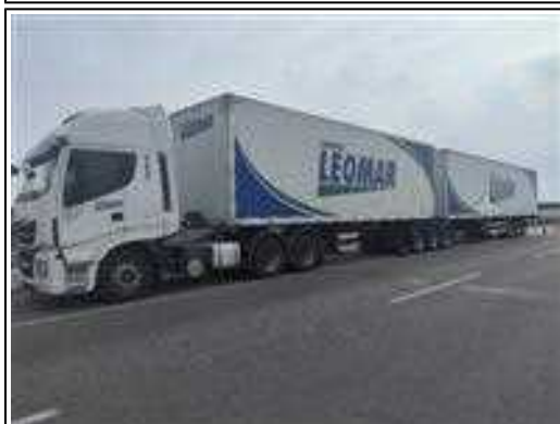
IMAGEM DA LATERAL ESQUERDA