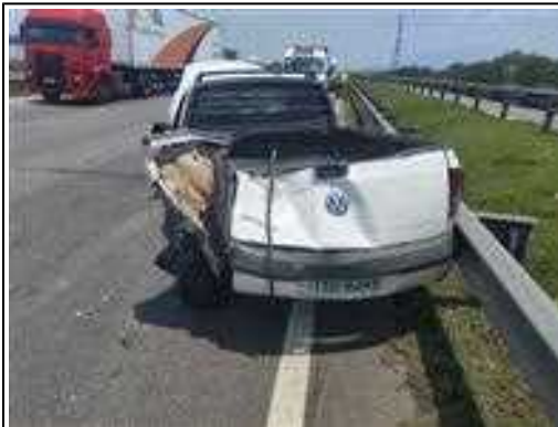
IMAGEM DA TRASEIRA