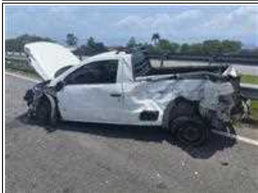
IMAGEM DA LATERAL ESQUERDA