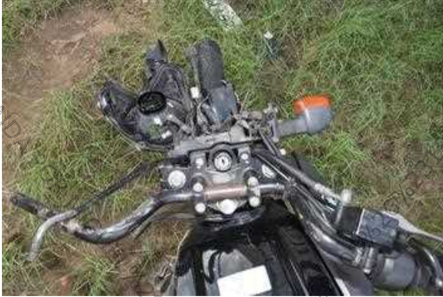
Figura 22. Danos aparentes, de aspecto recente evidenciados por fraturas do suporte do retrovisor esquerdo e amolgadura do tanque de combustível.

A análise indicou que tais danos resultaram da aplicação de força direcionada inicialmente da frente para trás, seguida de força da direita para a esquerda.