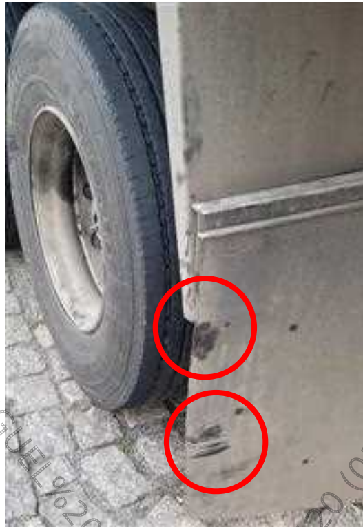
Figura 15. Semirreboque. Calças evidenciadas pelo contato do objeto contundente e a estrutura do para-barros.