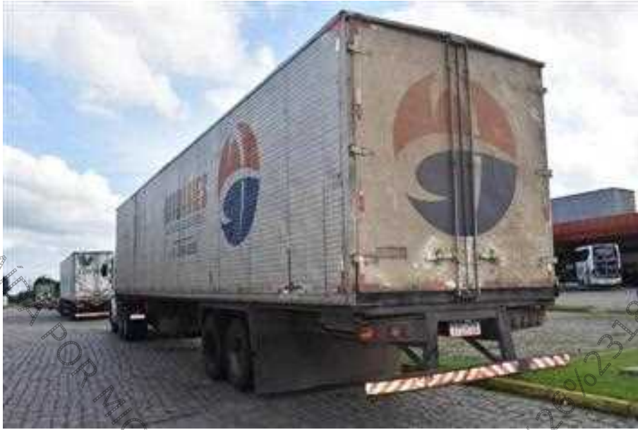
Figura 3. Reconhecimento do veículo.