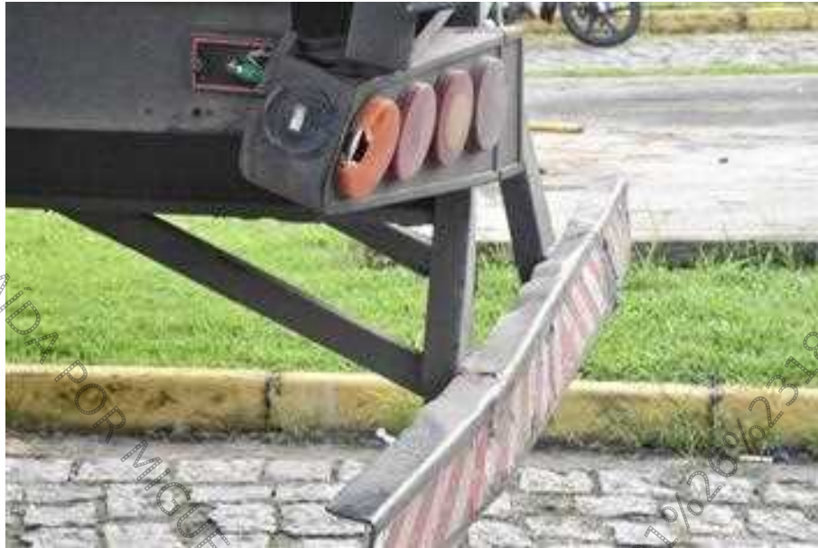
Figura 11. Semirreboque. Avarias evidenciadas por amolgaduras, atritamentos e fraturas localizadas no para-choques traseiro e no suporte de sustentação de lanternas esquerda de posicionamento e de indicação de direção decorrente da ação contusa de instrumento contundente dotado de energia mecânica orientada de trás para frente.