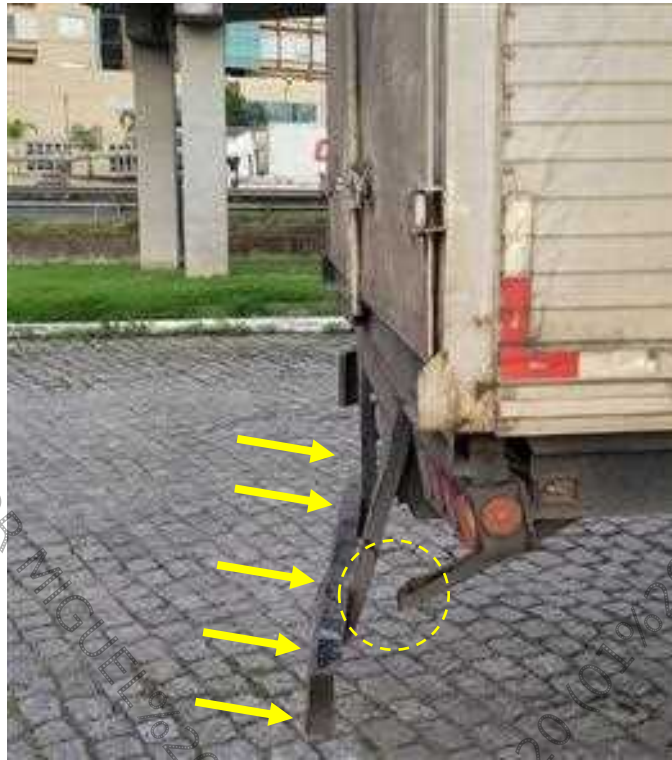
Figura 7. Semirreboque. Avarias evidenciadas por amolgaduras e fraturas localizadas no para-choques traseiro decorrente da ação contusa de instrumento contundente dotado de energia mecânica orientada de trás para frente. No círculo verifica-se ponto de fratura da estrutura metálica do para-choques em decorrência do choque mecânico aplicado na extremidade esquerda do para-choques.