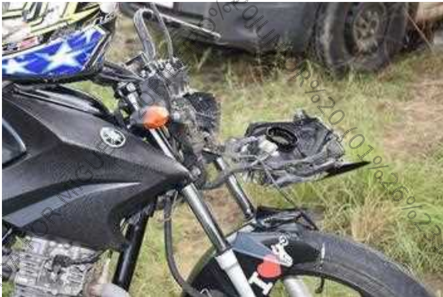
Figura 23. Avarias aparentes caracterizadas por amogaduras do sistema de suspensão dianteira, do tanque de combustível e fraturas do paralamas dianteiro, painel de instrumentos, farol dianteiro e carenagem do tanque de combustível.