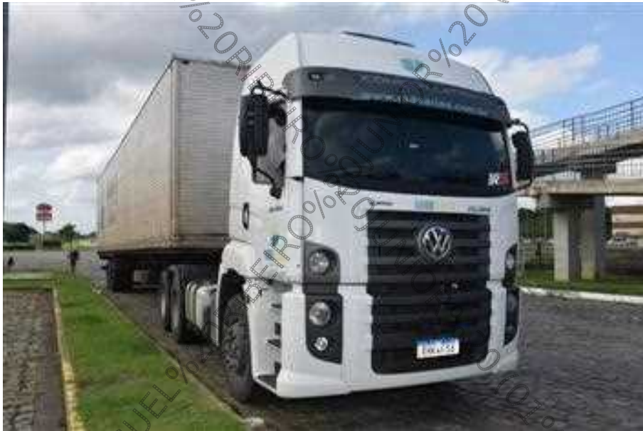
Figura 4. Reconhecimento do veículo.