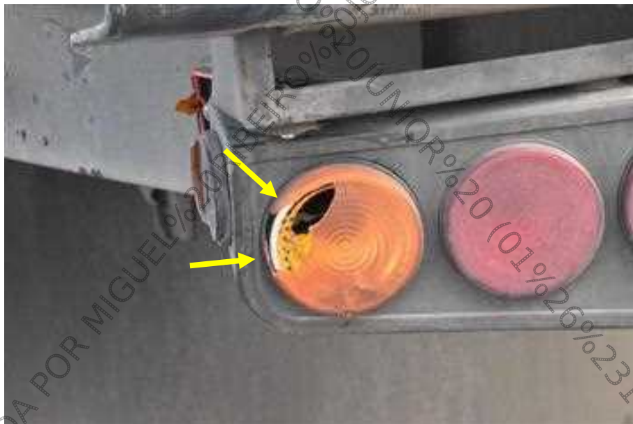
Figura 12. Semirreboque. Avarias evidenciadas por amolgaduras, atritamentos e fraturas localizadas no suporte de sustentação de lanternas esquerda de posicionamento e de indicação de direção decorrente da ação contusa de instrumento contundente dotado de energia mecânica orientada de trás para frente.