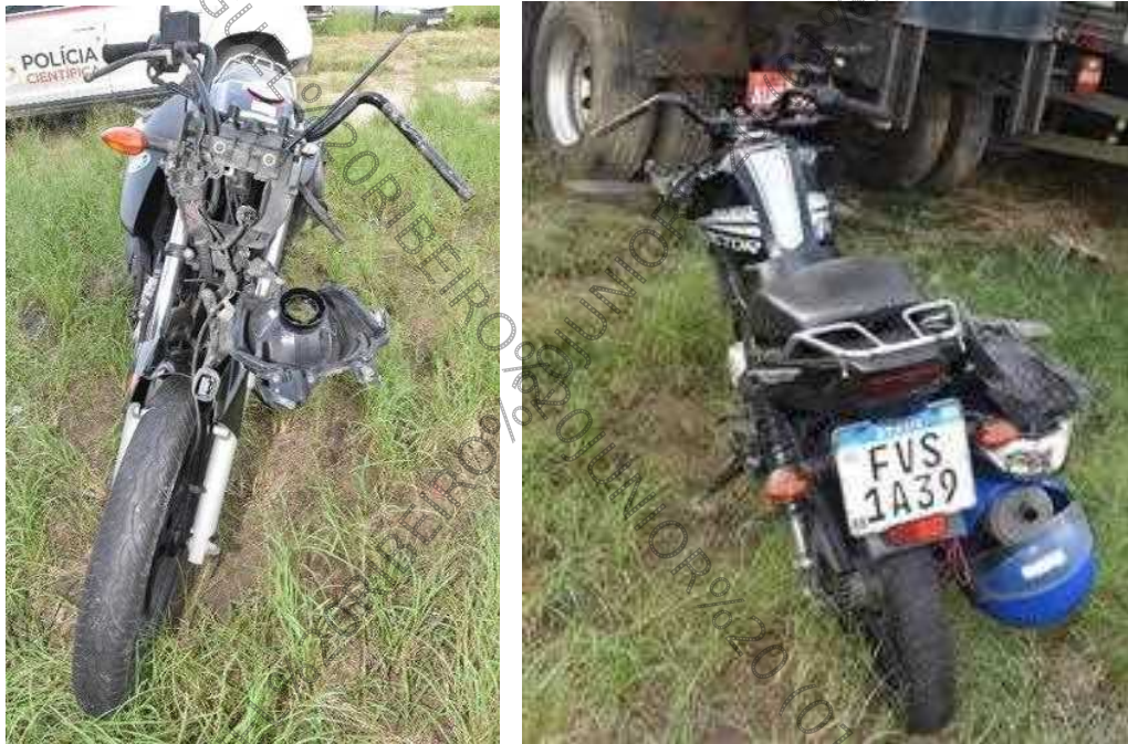
Figura 19. Reconhecimento do veículo.

O veículo apresentado e examinados por este Perito Relator no Pátio da Polícia Civil (Pátio Del Rey) no município de Registro - SP, correspondia a uma motocicleta da marca Yamaha, do modelo YBR 150 Factor ED, apresentando coloração preta. Sua fabricação ocorreu no ano 2018, correspondendo ao modelo do mesmo ano. O veículo exibia placas de licença FVS-1A39/Brasil, conforme visualmente documentado nas Figuras 19 a 21.