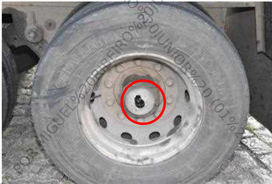
Figura 16. Semirreboque. Avarias evidenciadas por fratura da tampa do cubo de roda em decorrência do embate de instrumento contundente dotado de energia mecânica orientada de trás para frente.