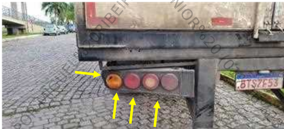
Figura 8. Semirreboque. Avarias evidenciadas por amolgaduras, atritamentos e fraturas localizadas no suporte de sustentação de lanternas esquerda de posicionamento e de indicação de direção decorrente da ação contusa de instrumento contundente dotado de energia mecânica orientada de trás para frente.