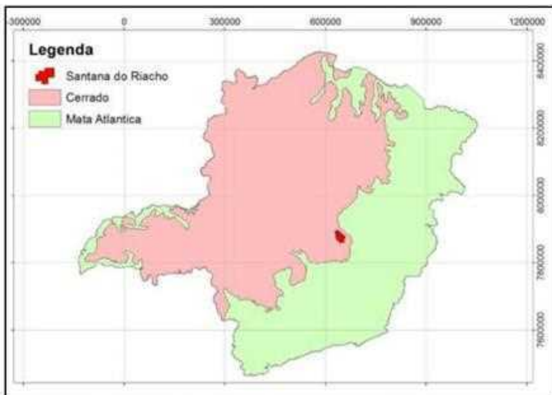
Figura 01: Mapa de biomas.

Conforme vistoria no local realizada no dia 04 de abril de 2019 foi constatado que Reserva Legal da Fazenda Jardim é composta por duas áreas de vegetação nativa distribuídas dentro dos limites da propriedade, uma área com 2,15 ha (dois hectares e quinze ares) e outra com 9,10 ha (nove hectares e 10 ares) com tipologia florestal características do bioma Cerrado Stricto Sensu em bom estado de conservação. (vide Figura 02)