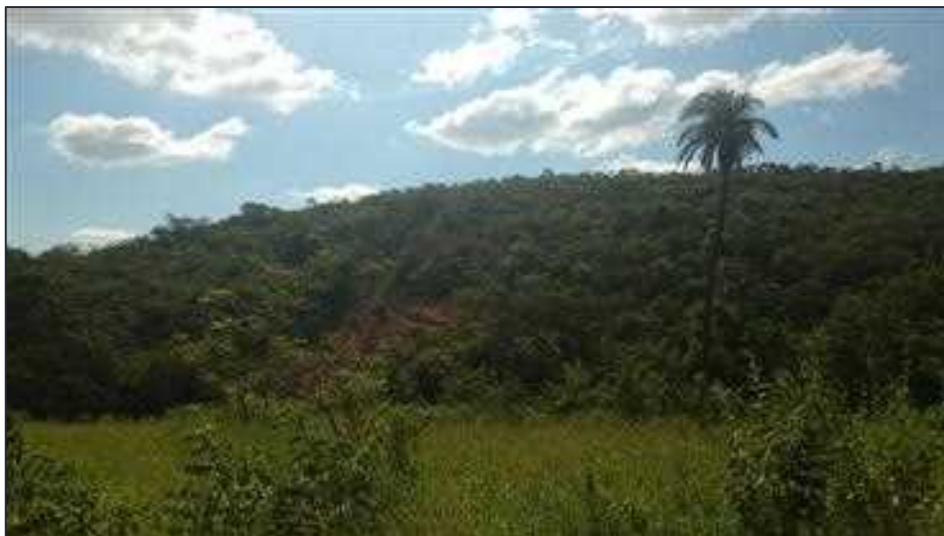
Figura 11: Vista geral da vegetação nativa da RL de 9,10 ha.