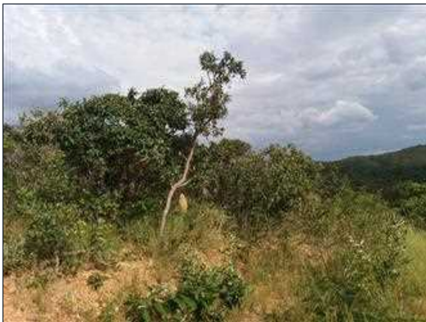
Figura 03: Vista geral da vegetação nativa referente a RL de 2,15 ha.

Não foi verificado vestígios de remoção da vegetação natural, a área com pouca vegetação ocorre em consequência da característica dos solos da região.