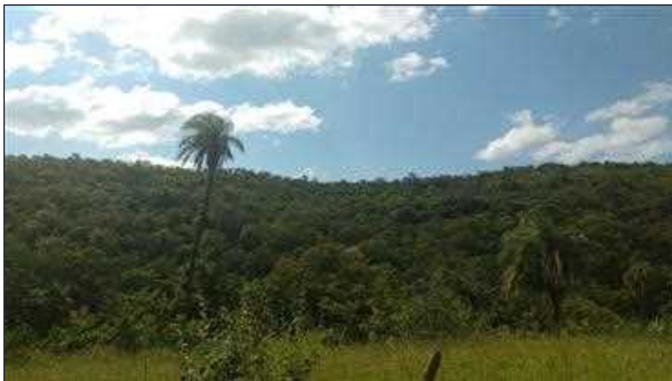
Figura 08: Vista geral da vegetação nativa da RL de 9,10 ha. Fonte: Autor