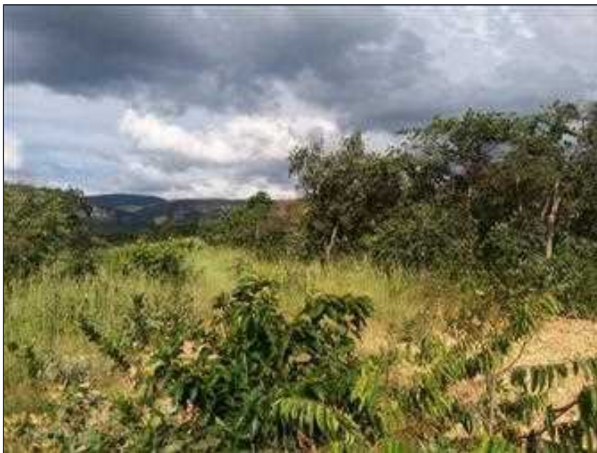
Figura 04: Vista geral da vegetação nativa referente a RL de 2,15 há.