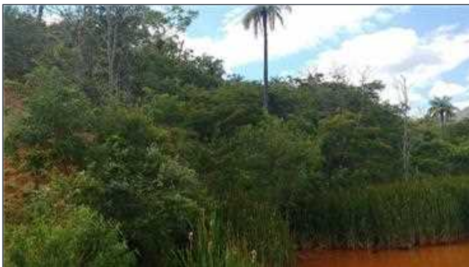
Figura 09: Vista geral da vegetação nativa da RL de 9,10 ha.