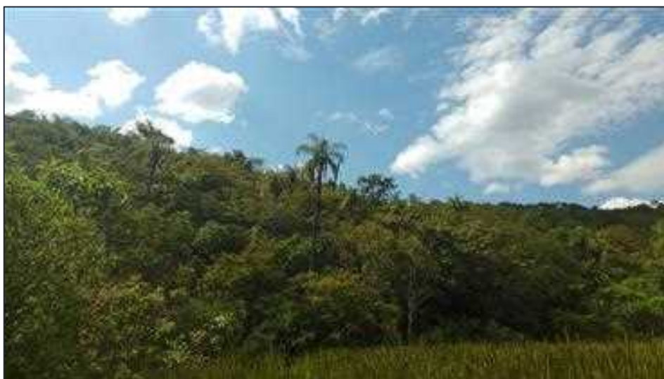
Figura 07: Vista geral da vegetação nativa da RL de 9,10 ha.

A RL com área de 9,10 ha (nove hectares e 10 ares) está situada na posição norte da propriedade, nas coordenadas geográficas (DATUM SIRGAS 2000 23k) 19^{\circ}03'23.4''S e 43^{\circ}45'48.6''W . Em vistoria ao local, foi verificado que a área encontra-se preservada e cercada, composta por vegetação nativa. (vide Figuras 07, 08, 09, 10 e 11)