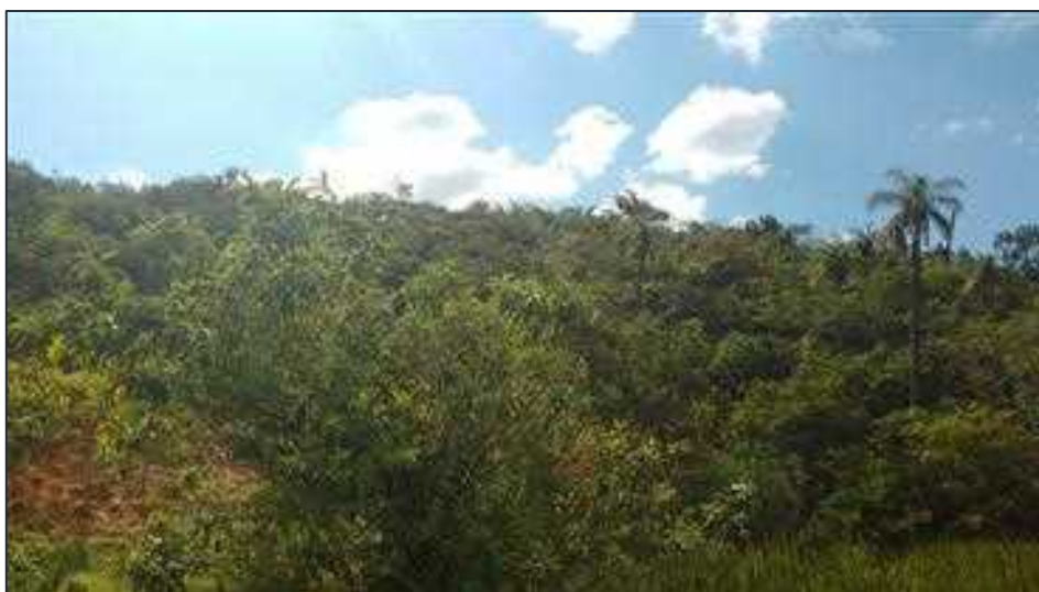
Figura 10: Vista geral da vegetação nativa da RL de 9,10 ha.