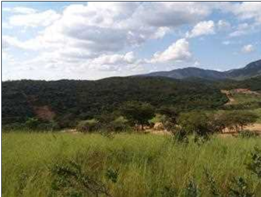
Figura 06: Vista geral da porção da RL com pouca vegetação nativa.

A RL com área de 9,10 ha (nove hectares e 10 ares) está situada na posição norte da propriedade, nas coordenadas geográficas (DATUM SIRGAS 2000 23k) 19^{\circ}03'23.4''S e 43^{\circ}45'48.6''W . Em vistoria ao local, foi verificado que a área encontra-se preservada e cercada, composta por vegetação nativa. (vide Figuras 07, 08, 09, 10 e 11)