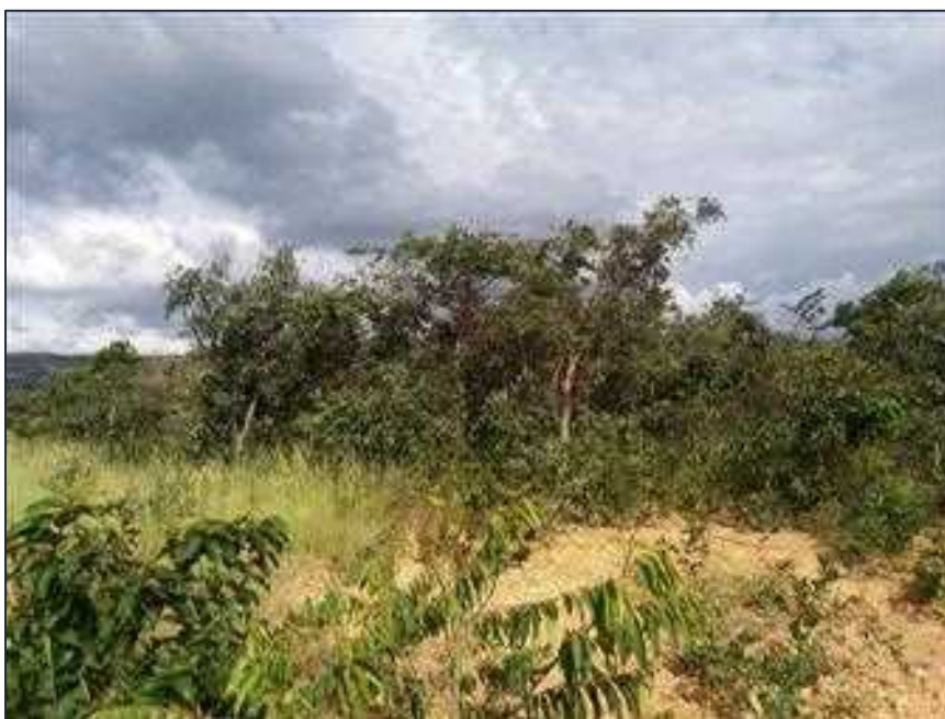
Figura 05: Vista geral da Reserva Legal.