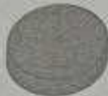
GRÁFICO REPRESENTATIVO DA PENA PRIVATIVA DE LIBERDADE

● Pena Cumprida (0a0m0d) - 0% ● Pena Remanescente(0a0m0d) - 100%