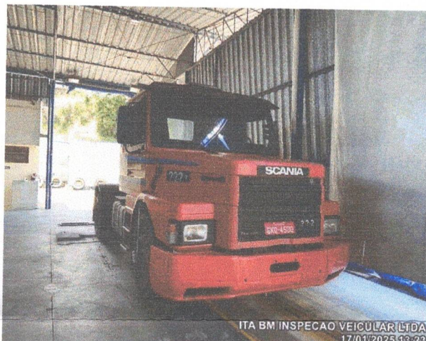
ITA BM INSPECAO VEICULAR LTDA 17/01/2025 13:23