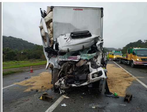
IMAGEM DA FRENTE