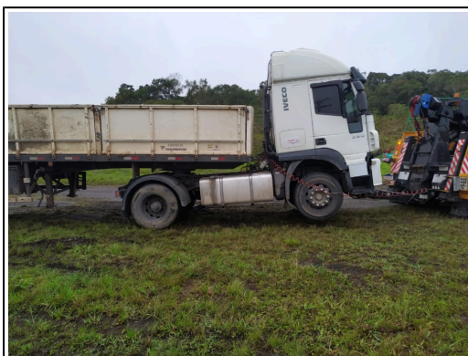
IMAGEM DA LATERAL DIREITA