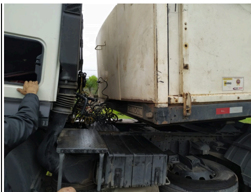
IMAGEM DA FRENTE