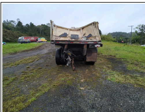
IMAGEM DA TRASEIRA