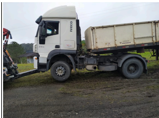
IMAGEM DA LATERAL ESQUERDA