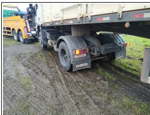
IMAGEM DA TRASEIRA