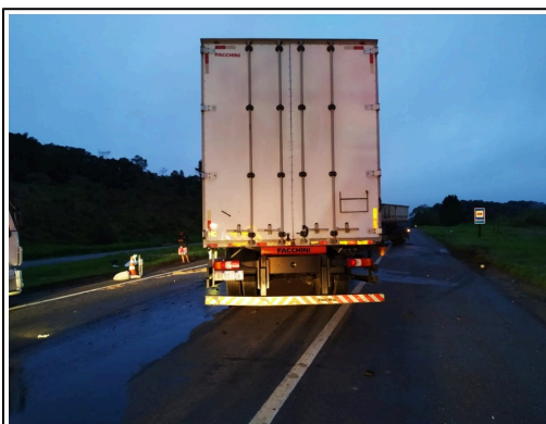
IMAGEM DA TRASEIRA