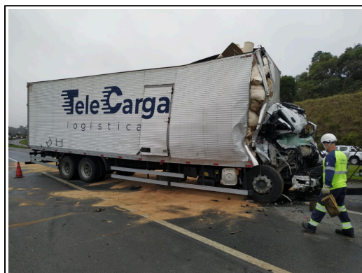
IMAGEM DA LATERAL DIREITA