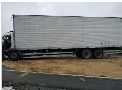
IMAGEM DA LATERAL ESQUERDA