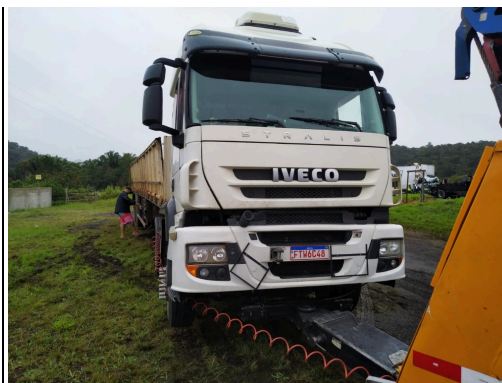
IMAGEM DA FRENTE