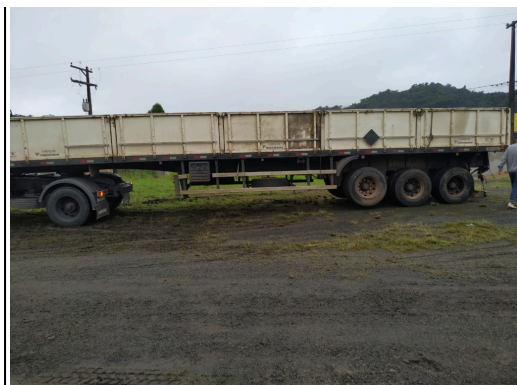
IMAGEM DA LATERAL ESQUERDA