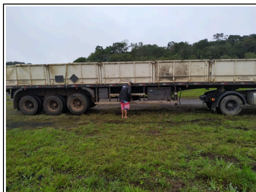
IMAGEM DA LATERAL DIREITA