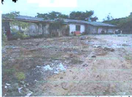
Foto 06: Depois. Galpão sem nenhum resíduo. Foto tirada em 19/02/2018.