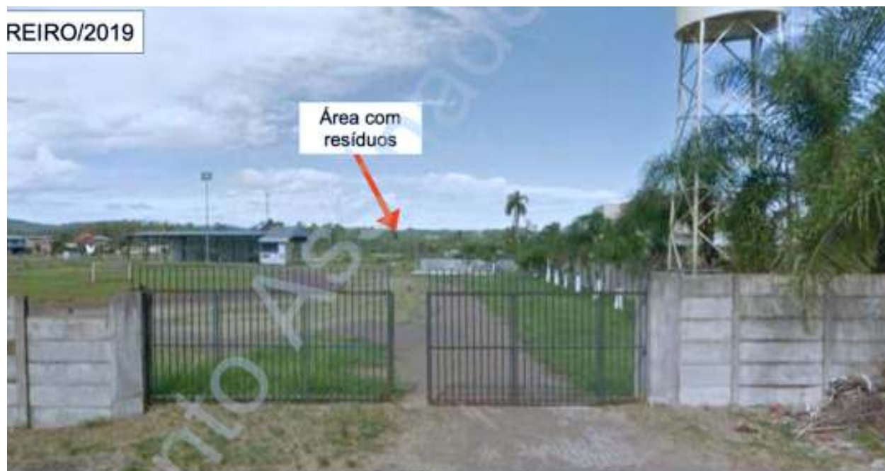
Imagem da ferramenta Google Street View , datada de fevereiro/2019, mostrando o portão de acesso ao estabelecimento de Parobé e, ao fundo, a área em que foram aterrados resíduos.

Procedimento nº 00952.001.220/2021 — Inquérito Policial