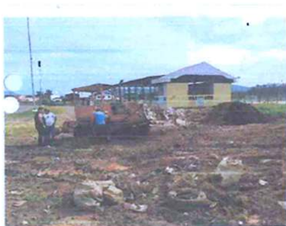
Foto 01: Operadores no local e a máquina que estava remobilizando o aterro.

Fotografia constante do laudo pericial ao evento n.º 8, demonstrando compatibilidade de identificação entre os resíduos sólidos industriais depositados irregularmente nas duas áreas.