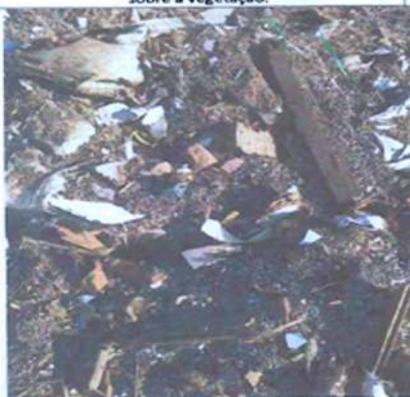
Foto 07: Resíduos plásticos triturados dispostos sobre a vegetação.