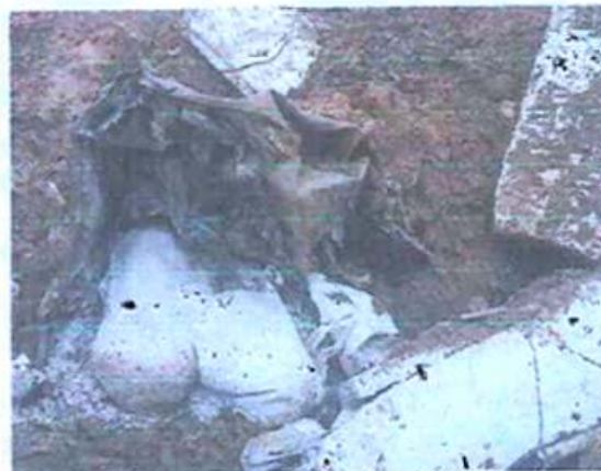
Foto 08: Resíduo disposto dentro de container e enterrado sob laje de concreto.