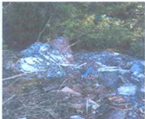
Foto 01: Resíduos plásticos triturados dispostos sobre a vegetação.

Procedimento nº 00952.001.220/2021 — Inquérito Policial