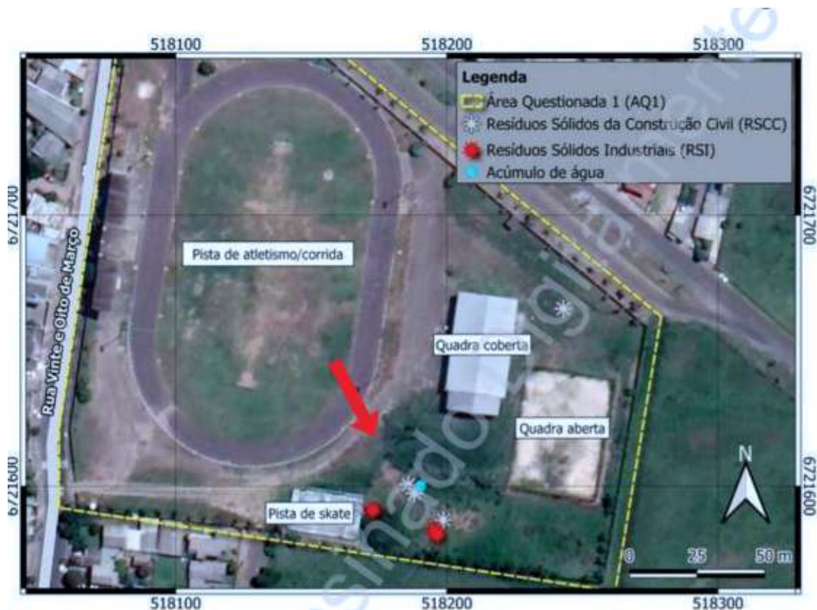
Figura 4: Intervenção sobre imagem de satélite de alta resolução obtida no programa Google Earth, datada de 24/10/2020, mostrando a Área Questionada 1 e elementos de interesse criminalísticos observados, com destaque para os resíduos na porção sudeste.

Procedimento nº 00952.001.220/2021 — Inquérito Policial