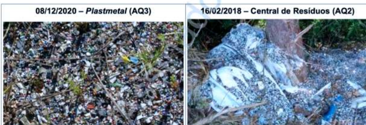
Figura 19: Composição de fotografia feita na Área Questionada 3 (antiga Plastmetal ) durante os exames periciais em 08/12/2020, à esquerda, e de imagem enviada através de DVD anexo ao ofício solicitante, referente à fiscalização na Área Questionada 2 (Central de Resíduos) em 16/02/2018, à direita, mostrando a compatibilidade entre os resíduos.

As fotografias do laudo pericial juntado ao evento n.º 8 identificaram a compatibilidade de os resíduos sólidos industriais localizados nas duas áreas