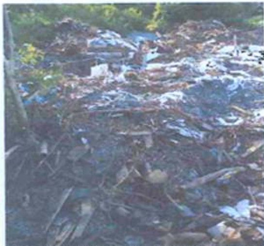
Foto 05: Resíduos plásticos triturados dispostos sobre a vegetação.

Procedimento nº 00952.001.220/2021 — Inquérito Policial