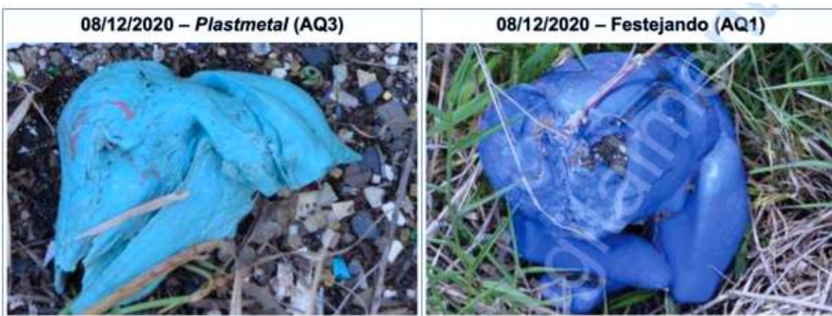
Figura 18: Composição de fotografias feitas na Área Questionada 3 (antiga Plastmetal ), à esquerda, e na Área Questionada 1 (Parque Festejando), à direita, durante os exames periciais em 08/12/2020, mostrando a compatibilidade entre os resíduos industriais observados.