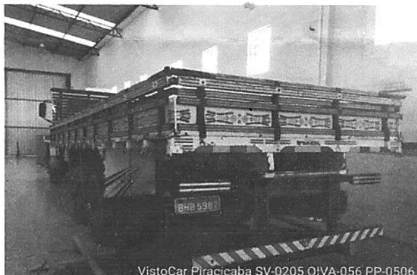
VistoCar Piracicaba SV-0205 OIVA-056 PP-0506