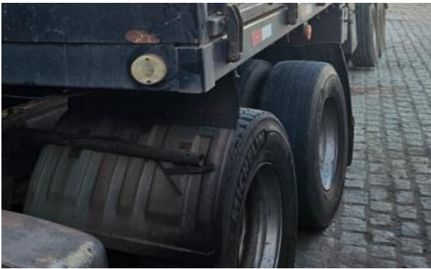
Jogo e roda lado esquerdo