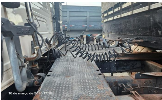
Conexão parte elétrica