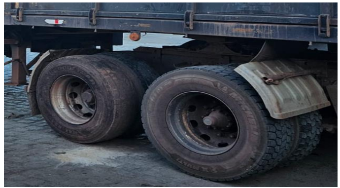
Jogo e roda lado direito