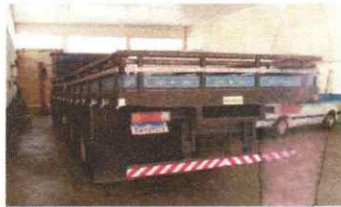
SERRA VISTORIA LTDA - ME DATA: 30/05/2025 HORA: 14:29:09