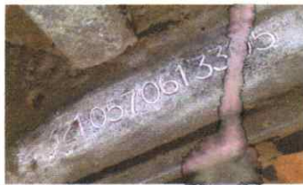
SERRA VISTORIA LTDA - ME DATA: 30/05/2025 HORA: 14:31:58