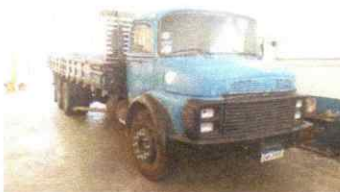
SERRA VISTORIA LTDA - ME DATA: 30/05/2025 HORA: 14:28:48