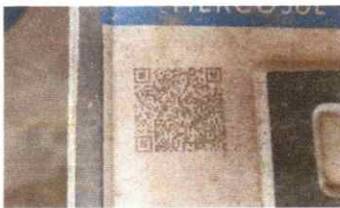
SERRA VISTORIA LTDA - ME DATA: 30/05/2025 HORA: 14:29:33