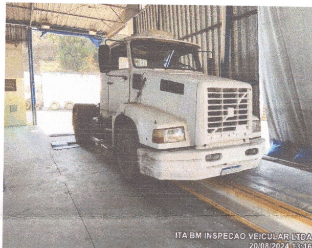
ITA BM INSPECAO VEICULAR LTDA 20/08/2024 13:16