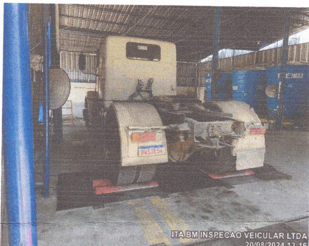
ITA BM INSPECAO VEICULAR LTDA 20/08/2024 13:16