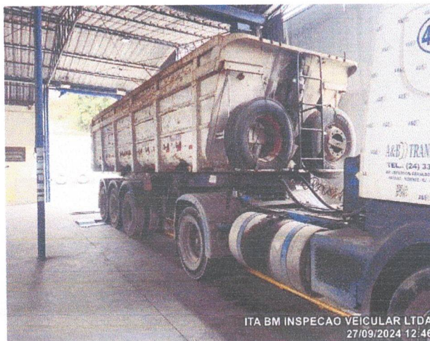
ITA BM INSPECAO VEICULAR LTDA 27/09/2024 12:46