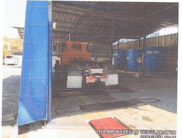
ITA BM INSPECAO VEICULAR LTDA 22/08/2024 13:46