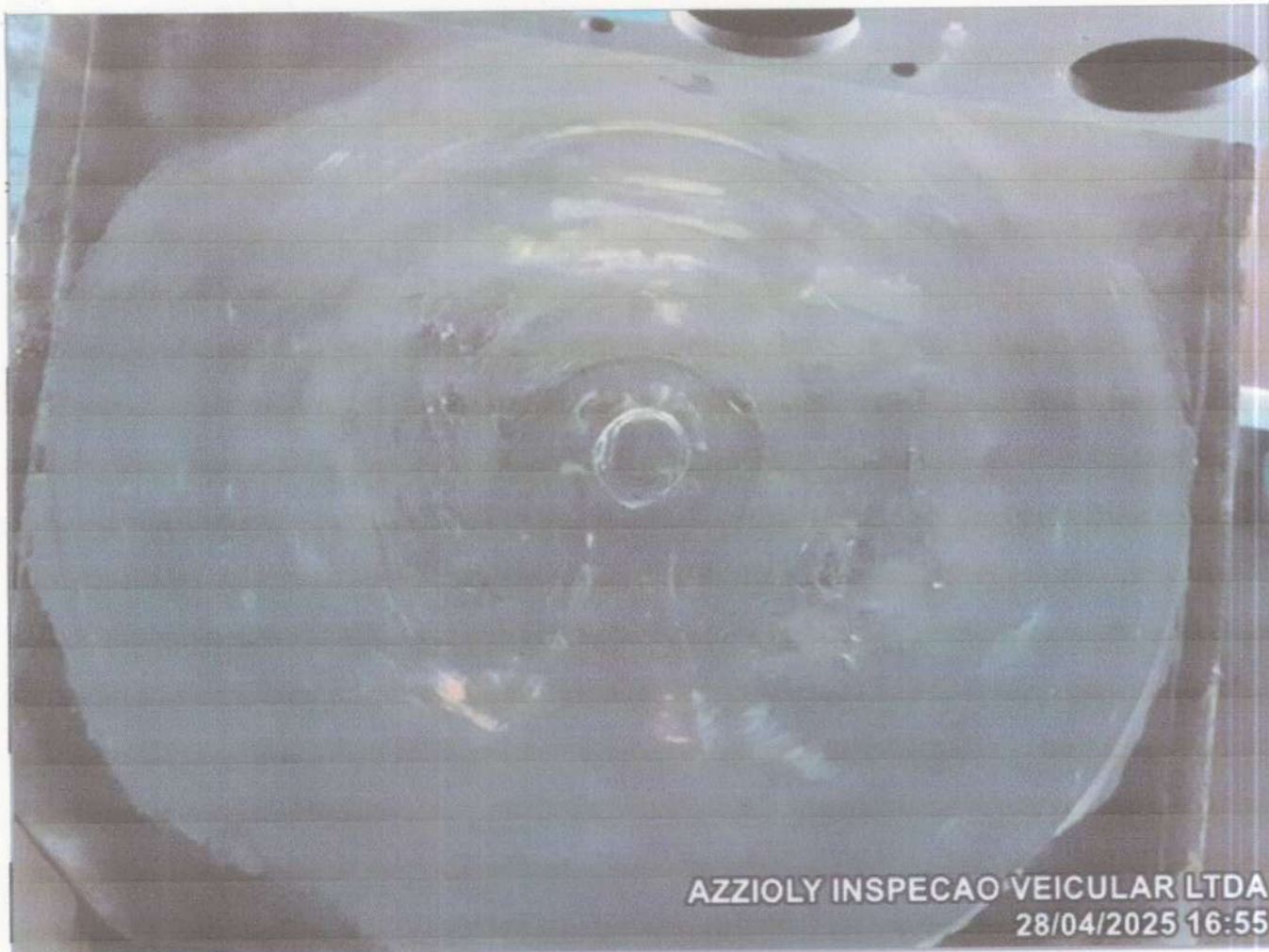
MESA PINO REI