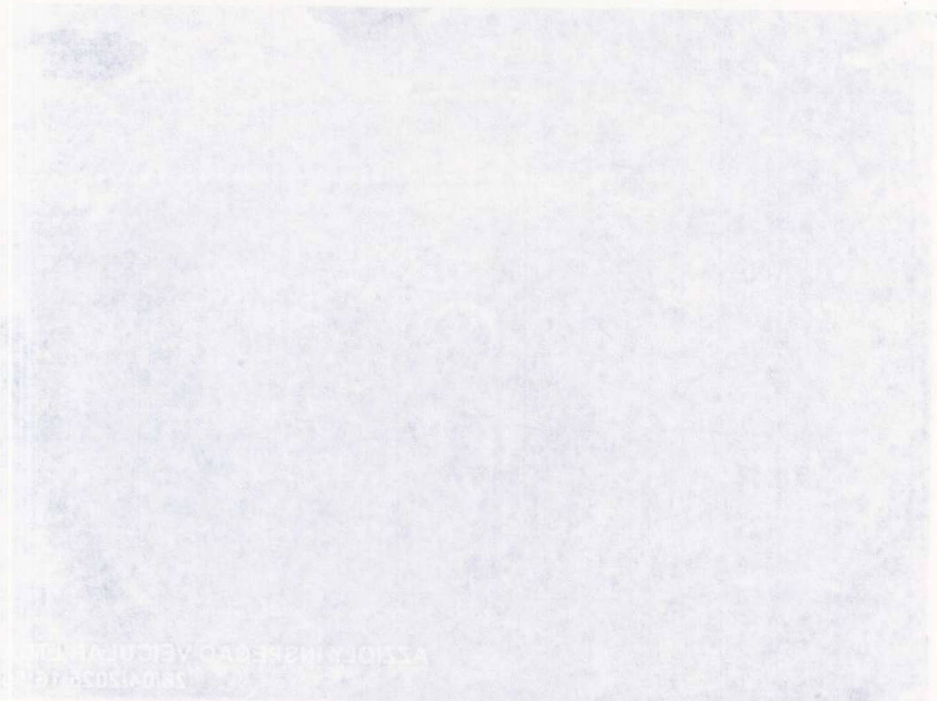
MEZA PIND REI