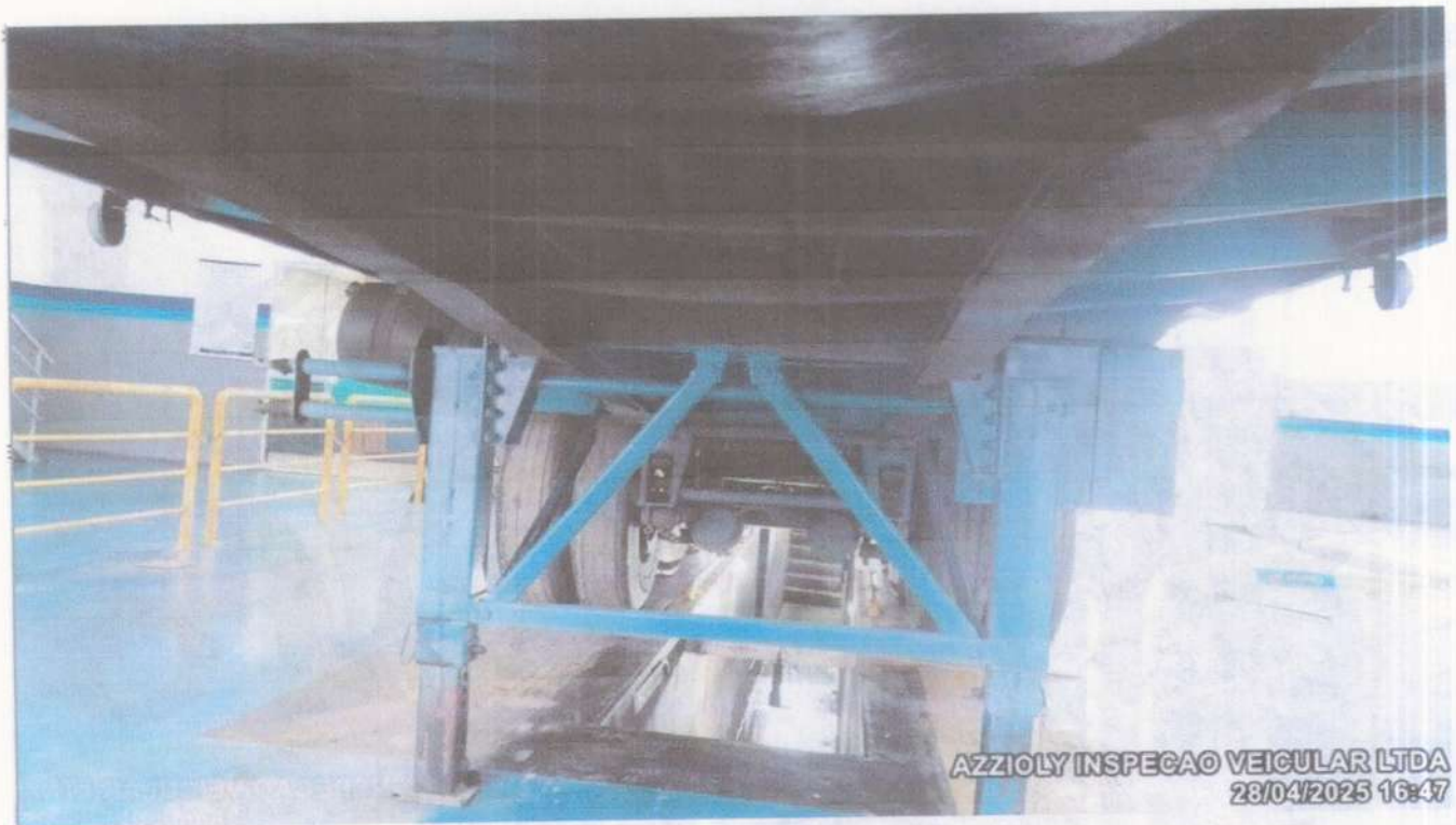
PE DA CARRETA