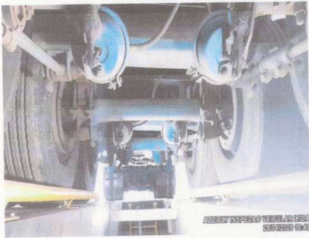
EIXO(S) TRASEIRO(S) E A I