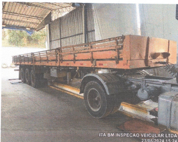
ITA BM INSPECAO VEICULAR LTDA 23/08/2024 15:24