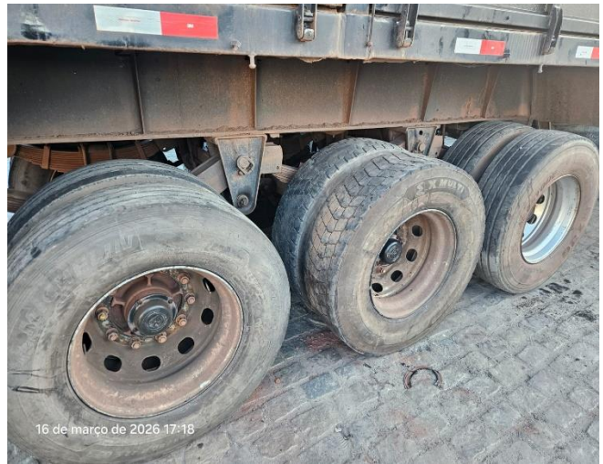
Eixo lado direito