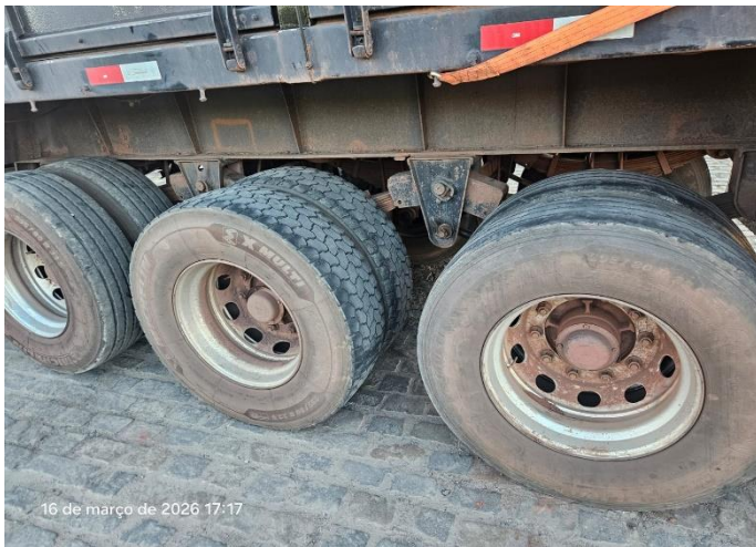
Eixo lado Esquedo