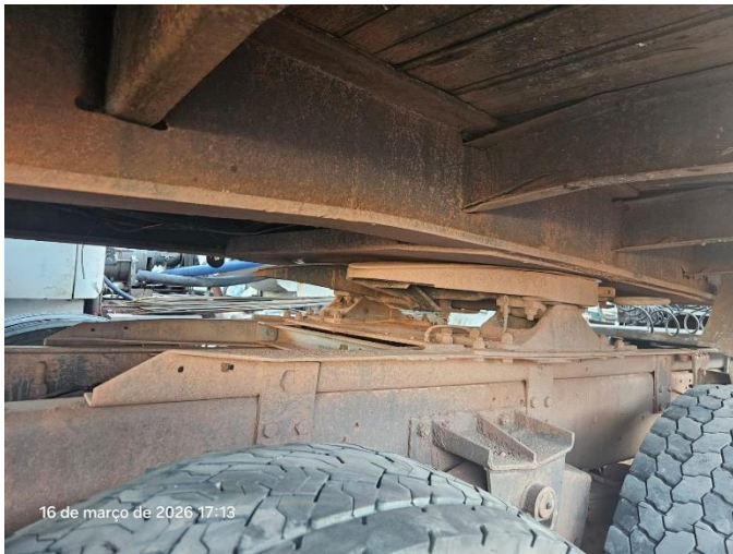
Engate do pino rei