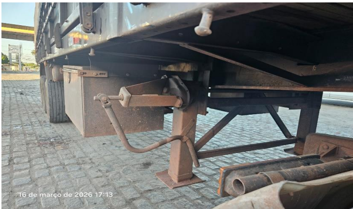
Aparelhos de Levantamento