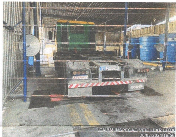
ITA BM INSPECAO VEICULAR LTDA 30/08/2024 16:56