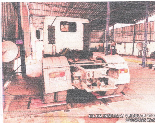
ITA BM INSPECAO VEICULAR LTDA 22/05/2025 09:53