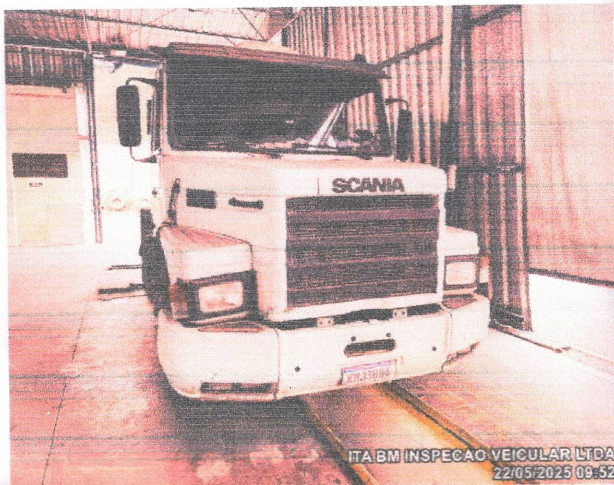
ITA BM INSPECAO VEICULAR LTDA 22/05/2025 09:52