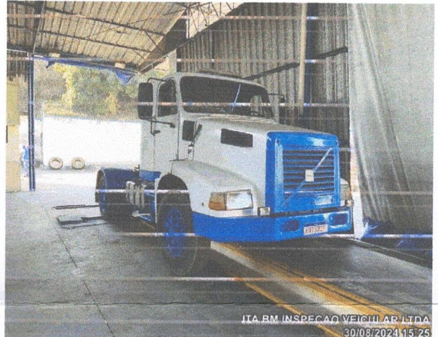
ITA BM INSPECAO VEICULAR LTDA 30/08/2024 15:25