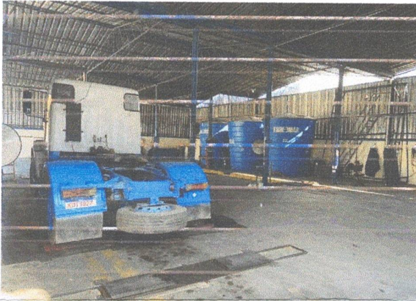
ITA BM INSPECAO VEICULAR LTDA 30/08/2024 15:24