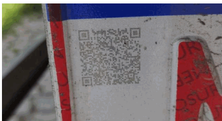
262 VISTORIA EIRELI DATA: 24/01/2023 HORA: 13:28:25 LAT: -20,250928 LONG: -40,372890