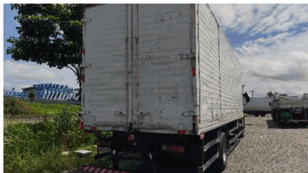
262 VISTORIA EIRELI DATA: 24/01/2023 HORA: 13:28:03 LAT: -20,250900 LONG: -40,372902