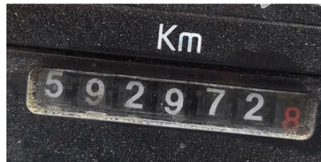
262 VISTORIA EIRELI DATA: 24/01/2023 HORA: 13:30:30 LAT: -20,251026 LONG: -40,372950