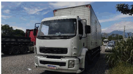
262 VISTORIA EIRELI DATA: 24/01/2023 HORA: 13:27:17 LAT: -20,251067 LONG: -40,372961