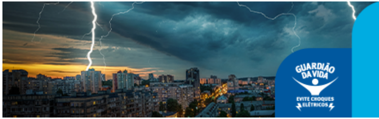
Imagem meramente ilustrativa, não representa a realidade.

Atividade a ser realizada com o valor atribuído para fins de crédito.