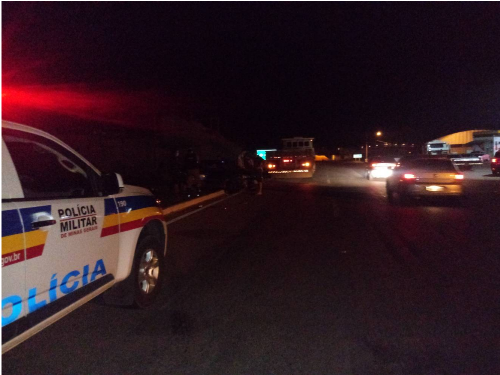
FOTO ACIDENTE 1